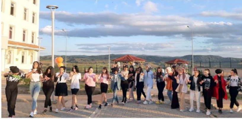
Sungurlu KYK öğrencileri programda gönüllerince eğlendiler.

"Eğitim öğretim döneminin son günlerinde öğrencilerin streslerini atmaları, final sınavlarına daha moralli girmeleri amacıyla, çalışanlar ile birlikte hazırlıklar yapılarak Murat & Arif ikilisinin şarkılarına, oyunlar ve halay çekerek eşlik eden yurdu öğrencileri unutulmaz bir gün yaşadılar. 5 yıldızlı otel konforunda, üstün standartlarda hizmet verilen Sungurlu yurdumuzda öğrencilerimizin sosyal, kültürel, sportif faaliyetler yanında, güvenlik, temizlik, beslenme gibi ihtiyaçları yurt idaresi tarafından bütün çalışanlarla birlikte hassasiyetle takip edilmekte, 476 yatak kapasitesiyle hizmet vermeye devam eden öğrenci yurdumuz , eğitim-öğretim döneminin sona ermesi ile yaz dönemi bakım-onarım çalışmaları yapılarak, yeni eğitim öğretim dönemine hazır hale getirilerek öğrencilerimizin hizmetine sunulacak" denildi. (İHA)