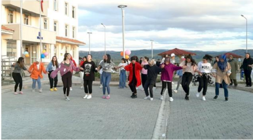
Öğrenciler programda bol bol halay çekerek stres attılar.